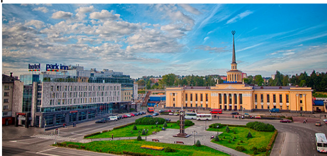
Petroskoin Park inn hotellimme vasemmalla.